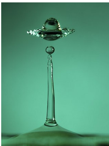
Drops, Hahnemühle Papier auf Aluminium, 80 x 60 cm