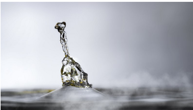
| Drops, Hahnemühle Papier auf Aluminium, 84 x 129 cm

Die Werke des Künstlers sind in nationalen und internationalen Sammlungen vertreten.