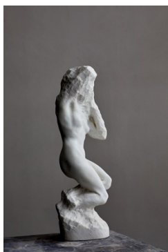
Weiblicher Akt, Marmor