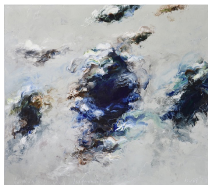
Verdichtung und Verflüchtung, 160 x 180 cm