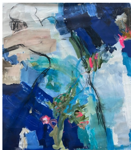
Untitled, Acryl auf Leinwand, 160 x 150 cm