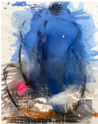
Untitled, Acryl Kohle auf Leinwand, 100 x 80 cm

The artist is represented in both national and international collections.