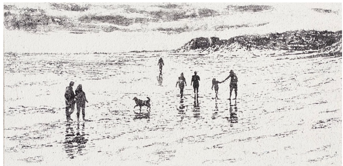
Strand am Meer, Mischtechnik auf Sackleinen, 60 x 120 cm