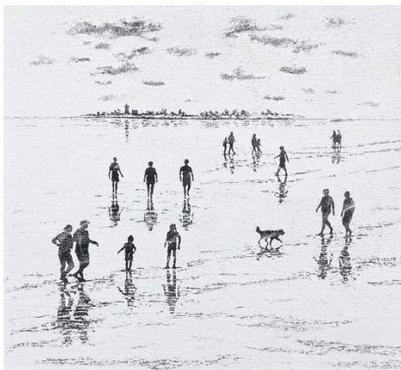
Inseln am Meer, Mischtechnik auf Sackleinen, 120 x 130 cm

At first glance, his palette appears limited to non-colors. Black-and-white painting sharp divisions and demands clarity. However, the artist succeeds in suggesting color by translating very bright highlights into strong contrasts. A sense of chromatic harmony emerges through the thick application of material layers on a coarsely woven surface, which allows light to shine through and gives the image its luminosity.