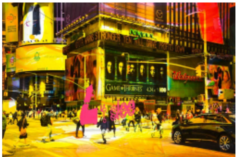
NY Reloaded B2, Mischtechnik auf Fotografie, 100 x 150 cm