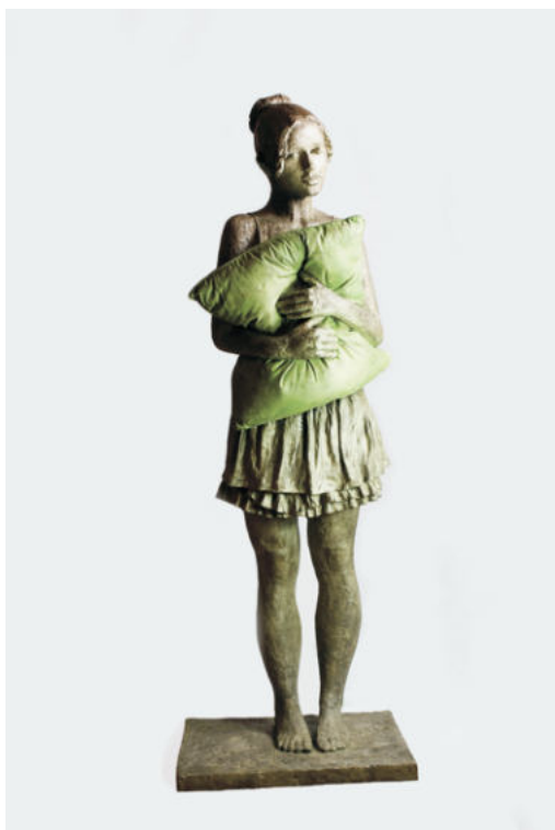
Sehnsucht – Bronze – 166 x 56 x 51 cm

Medaille, Firmengärten, Senat für Bau, Umwelt und Verkehr, Bremen - Brunnengestaltungselemente, Stadt Belgig Bronzeplastik Sitzende (Sehnsucht), Wangerooge - Bronzeplastiken „Tanz am Abgrund“, SWB Bremerhaven Skulptur „Sitzendes Mädchen“, Eichenholz, Kulturpark Tutti Kiesi, Rheinfelden bei Basel Skulptur „Sitzende“, Eichenholz, A + O Worpsswede - Bronze- und Steingußplastiken, Gutspark Klein Glien Bronzeplastik „Sitzende“, Schloß Laubach