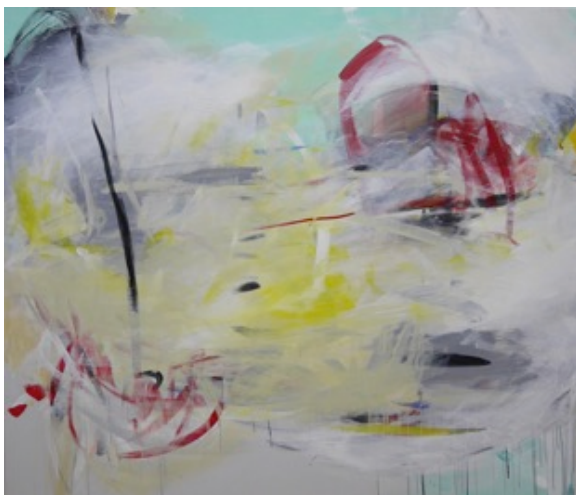
Acryl auf Leinwand – 160 x 185 cm