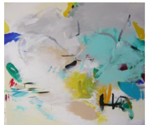
Acryl auf Leinwand – 100 x 115 cm