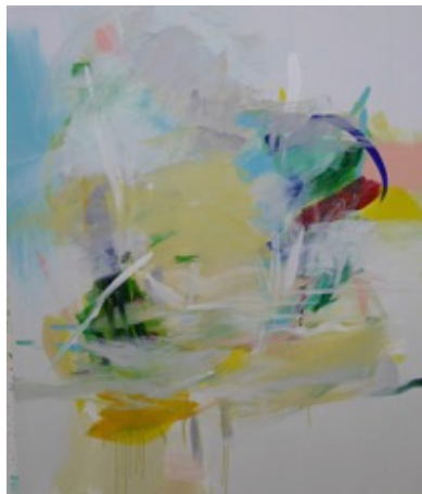
Acryl auf Leinwand 130 x 110 cm

Staatgalerie Stuttgart – Haus der Kunst München – Deutscher Bundestag Berlin – Musée de Morlaix, Bretagne – Ministerium für Wissenschaft, Forschung und Kunst Baden-Württemberg – Regierungspräsidium Stuttgart – Sammlung der Landesbank Baden-Württemberg – Sammlung LBS Stuttgart – Sammlung Deloitte & Touche GmbH, Stuttgart – Sammlung der Südwestbank Stuttgart